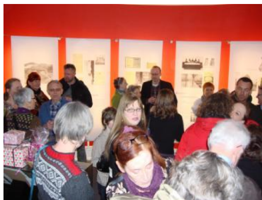
Receptionen startede i det historiske rum.

Receptionen blev afholdt den 15.02 kl. 16.00-18.00. Det var et lukket arrangement, hvor de 3 kvinder der har skrevet bogen havde inviteret venner, familie og de personer der har bidraget til bogen. Receptionen blev en succes og uden at vi har det nøjagtige mandtal, så var der ca. 150 personer på besøg i forbindelse med receptionen.